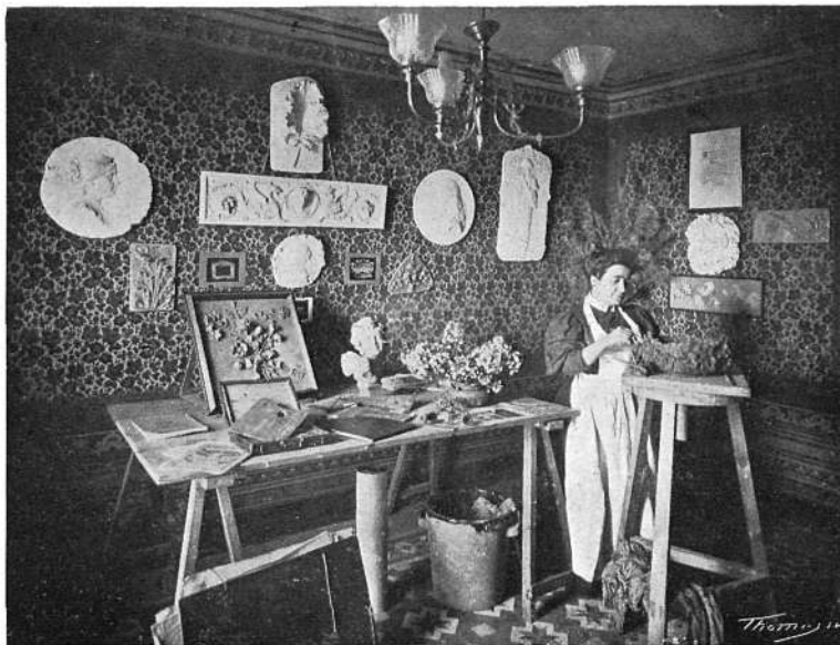
El seu taller

»Retrats en baix-relleu, busts de tamany natural, tots ells d'un realisme y semblansa sorprenents, entre'ls quals crida fortament l'admiraçió una testa de dama vene-