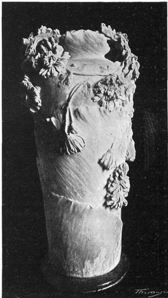
Dues de les seves obres