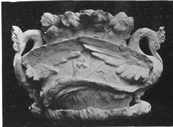
Bocet executat ab set hores, havent obtingut medalla en les oposicions de Febrer del 1907

Son moltes les obres de la simpàtica artista que no podèm enumerar aquí, més tots aquells qui visitaren la tómbola de FEMINAL, recordaran un preciós treball en baix relleu, presentant un gran medalló en el que hi surgia com exquisida aparició una preciosa testa de nena coberta ab els plechs d'un escayent mocador, y ja no solzament eren d'admirar les línies de la figura sinó'ls tons ab que